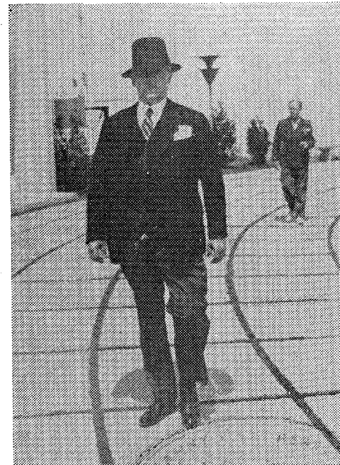
La „Luna Bucureștilor“ (1935).