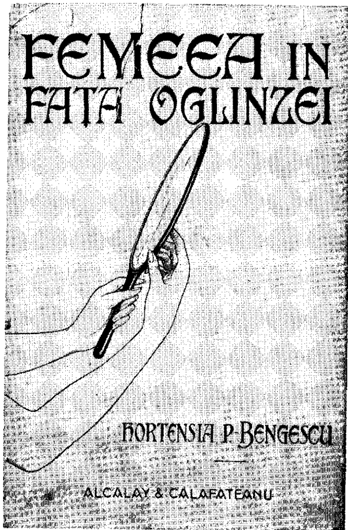
Coperta romnului Femeia în fața oglinzi , apărut la Alcalay & Calafateanu