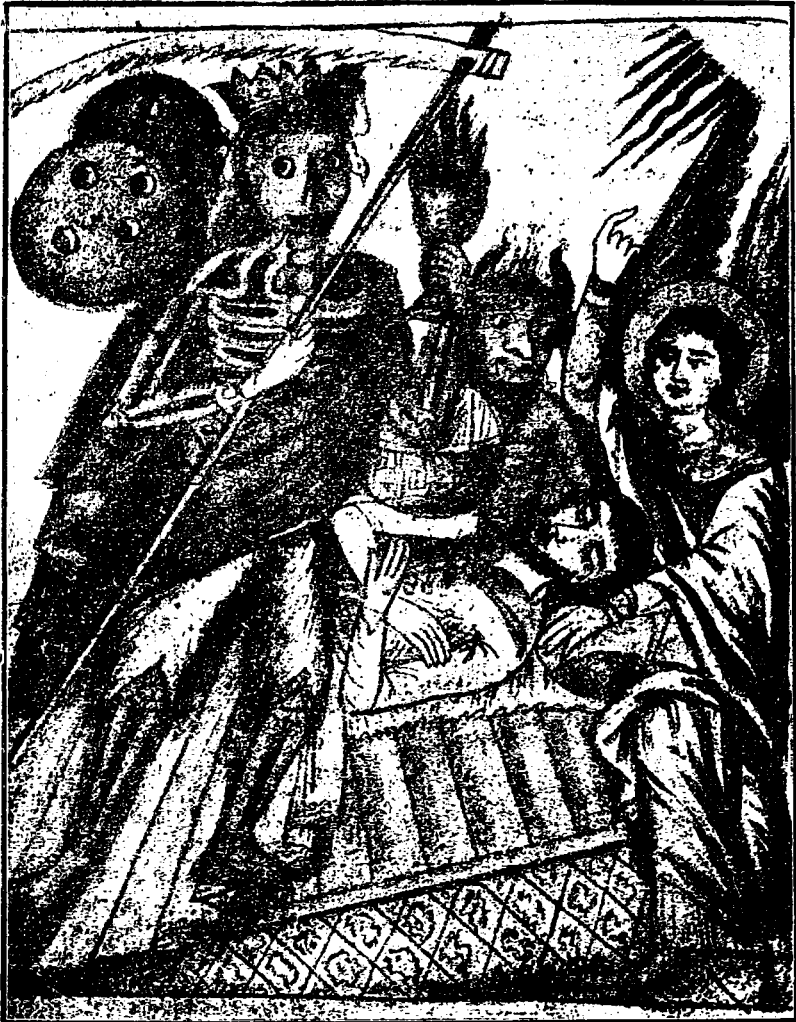
Fig. 4. ...Moartea mi-au sosit și Dracul m'au napadit...

Ne mai având ce să răspundă, moșneagul cu pricina și-a plecat capul și a mers după Moarte!" (1).