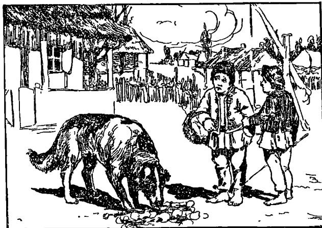
Fig. 3. Copiii umblând cu Câții-mâții , au răsturnat coșul cu ouăle de frica cânelui.

Acești flăcăi umblau prin jud. Dolj cu căldărușele cu jaratec