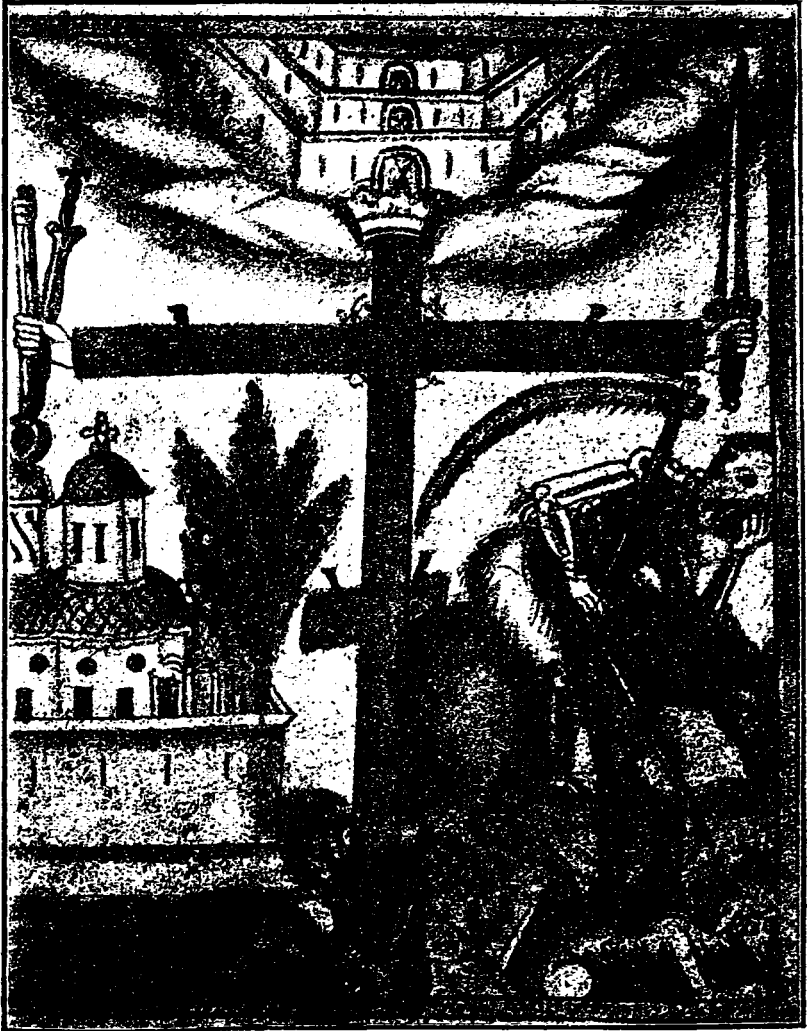
Fig. 3. Darâmarea Morții și a Diavolului.

șirea în cinste și'n ușurarea de păcate a vieții sale, caci numai astfel Moartea cea dureroasă va fi isgonită, adică, numai astfel se va putea pregăti adevărata vieță ; și atunci, omul trebuie să strige creștinește :