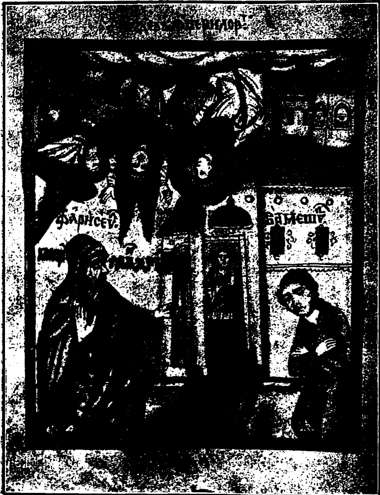
Fig. 1. Căderea Îngerilor (iconiță de pe o cărticică din c. 1720 (2).

țului, alții în fundul mării, alții pre pământ, alții în văzduh, alții într'apă. Și toți aceia căț[il]i au căzut de în cer [cu] acel voevod, făcutu-s'au diavol întunecat..." (1).