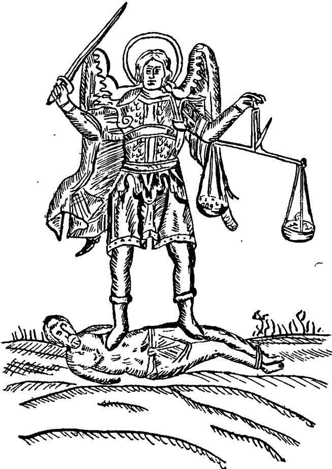
Fig. 2. Ingerul (Arhanghelul Mihail) cântărește, după lumea sufletului fa- tele răposatului (după Bianu și Hodoș, Bibliografia românească veche , I, p. 202).

Tot astfel cred și Bulgarii (1). În cele ce urmează, vom da o frumoasă povestire musceleană,