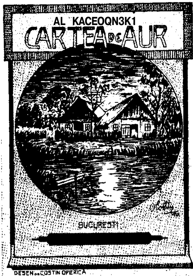
Cartea de aur, Buc, 1902, coperta.