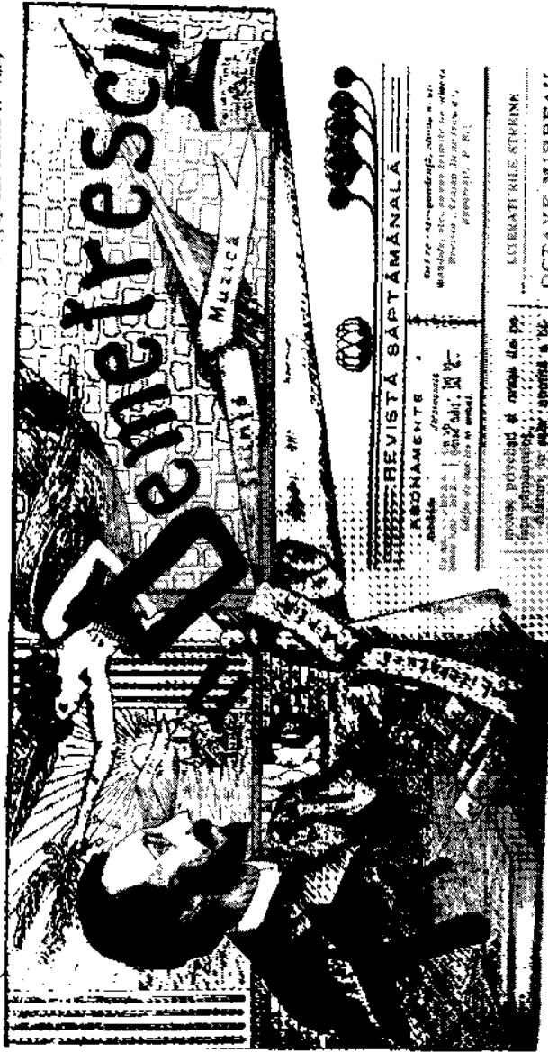
Trăia Ce nețreșcu, frontispiciu.

Cu ce era să plătească, bietul om, doctorul, moașa și doctoriile, din trei nenorociți galbeni ce avea?