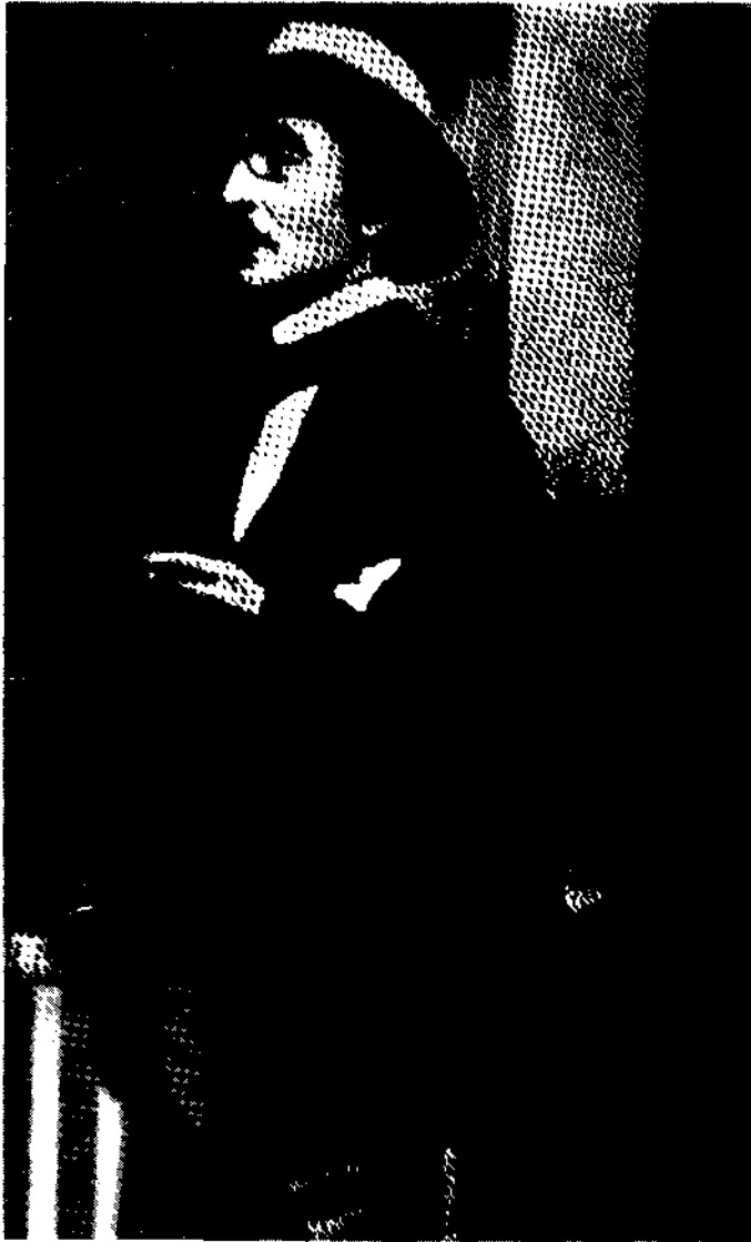
Portretul poetului Ia maturitn'o.

un ressort, ii empoigna son chibouc d'ime main formidable et fit pleuvoir sur l'cchine de la mégère de tels coups qu'il le lui cassa sur le dos,,.