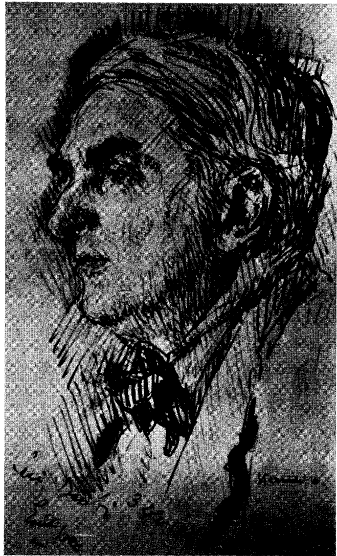
Portretul lui Emil Isac de Steriade (1936).