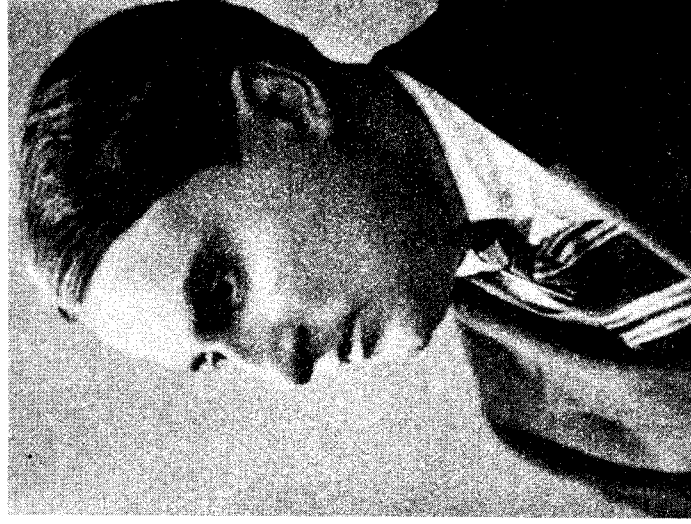
Poetul Emil Isac în anul 1920