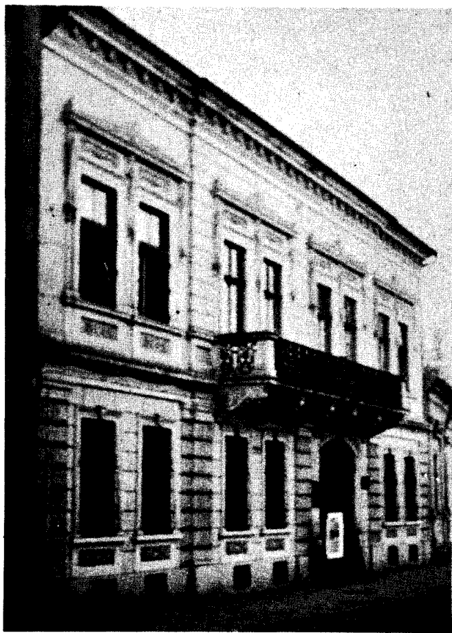
Casa familiei Isac în care a trăit și lucrat Emil Isac. În prezent sediul Muzeului memorial Emil Isac.