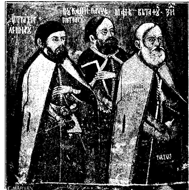
Mășterii de la Hurez.

PUBLICATĂ PENTRU „SOCIETATEA NAȚIONALĂ DE CREDIT INDUSTRIAL”.