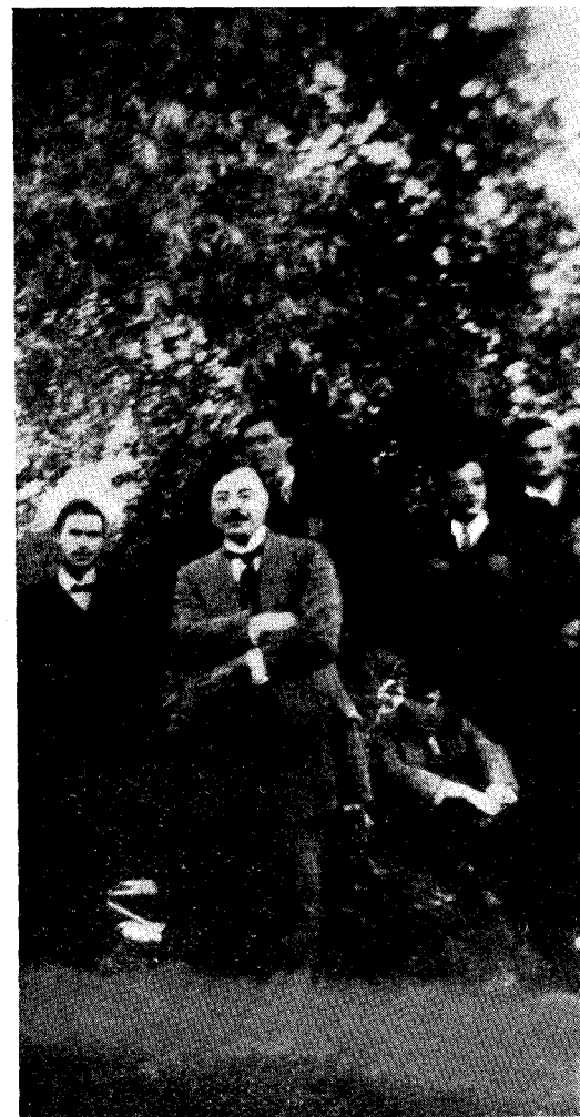
Dimitrie Gusti cu Seminarul de sociologie și etică al Facultății de litere și filozofie din Iași, în perioada 1911—1912, cu ocazia primelor cercetări pe teren, la Schitul Tărița.