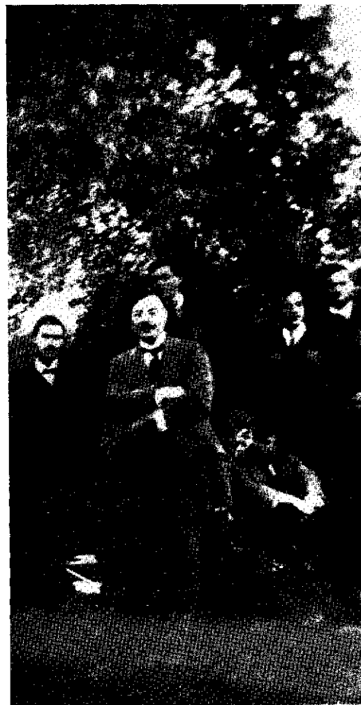
Dimitrie Guști cu Seminarul de sociologie și etică al Facultății de litere și filozofie din Iași, în perioada 1911—1912, cu ocazia primelor cercetări pe teren, la Schitul Târîța.