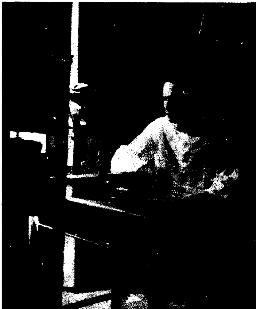
In casa familiei Dasgupta. Pe verso: „Mamei, de la băiatul din India. Bhowanipore, april 1930.”