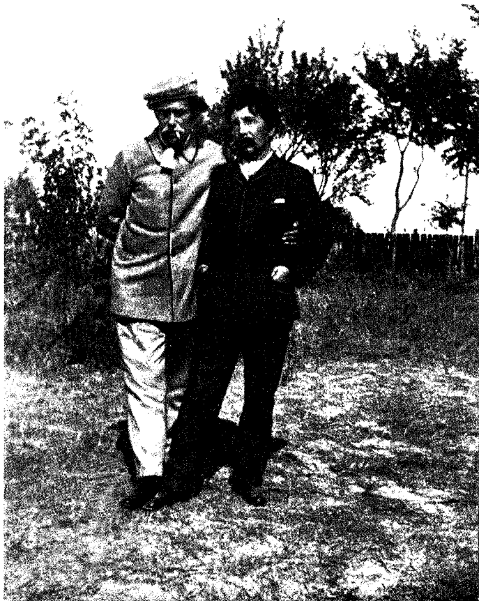
Delavrancea cu Vlahuță, în curtea casei de la Dragosloveni, în 1911.