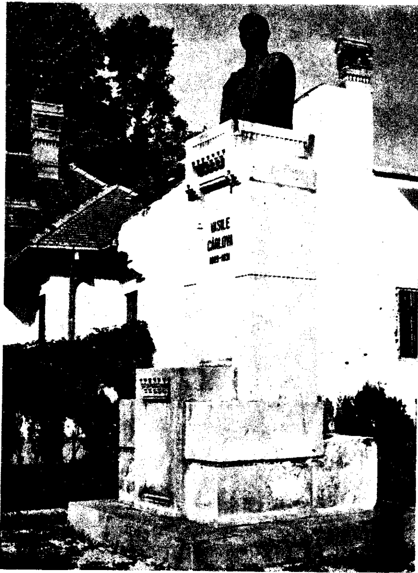
STATUIA LUI VASILE CÎRLOVA, DIN TIRGOVIȘTE (REALIZATĂ DE V. BLENDEA).