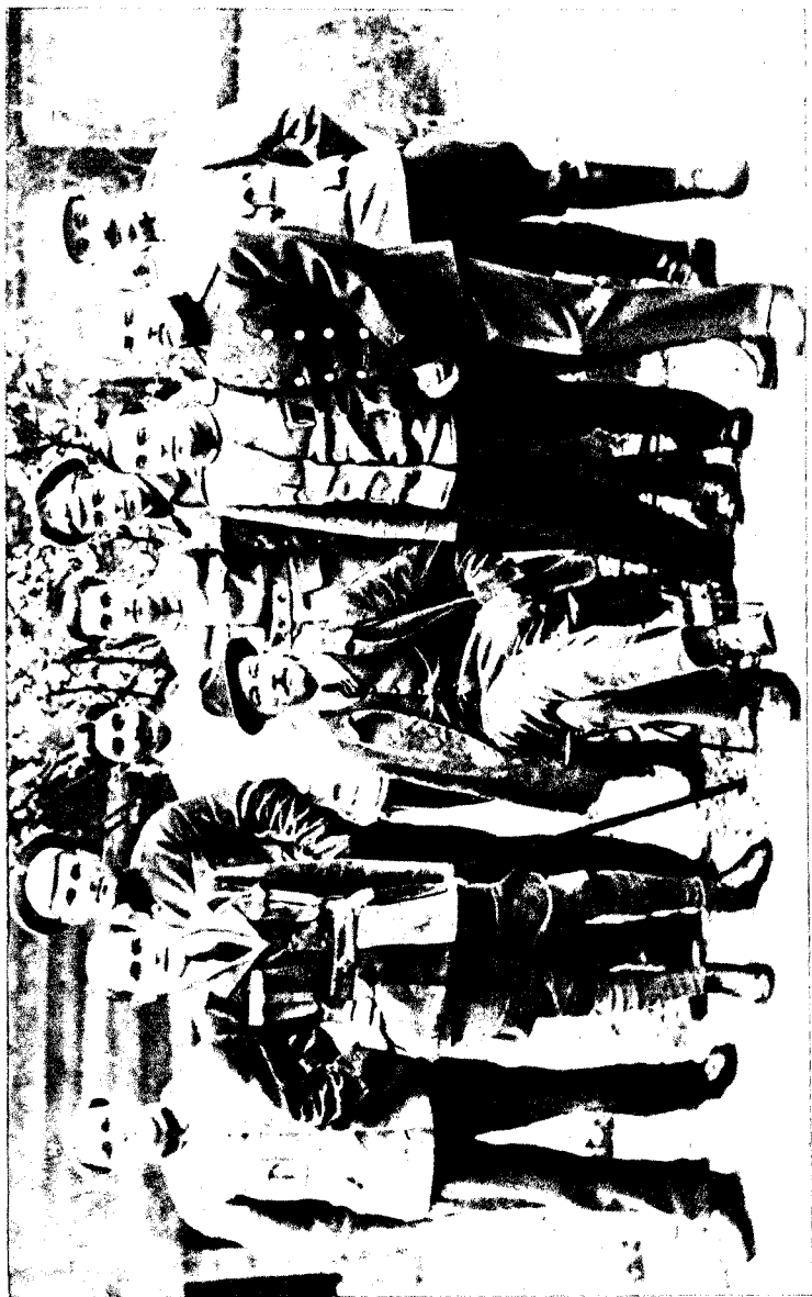
În lagăr (Germania) împreună cu alți prizonieri ruși și români (1917).