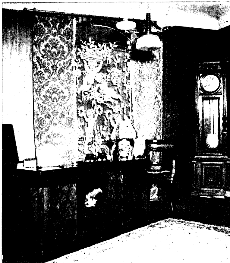
Biroul de lucru.