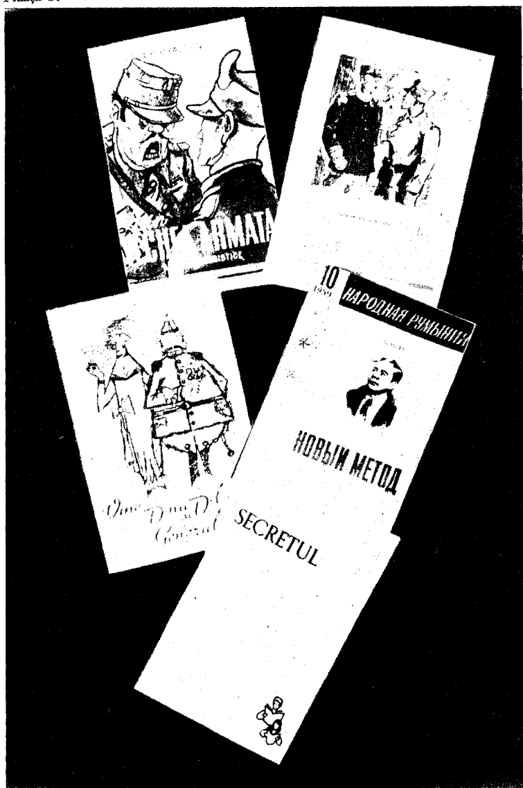
Ediții apărute după 23 august 1944.