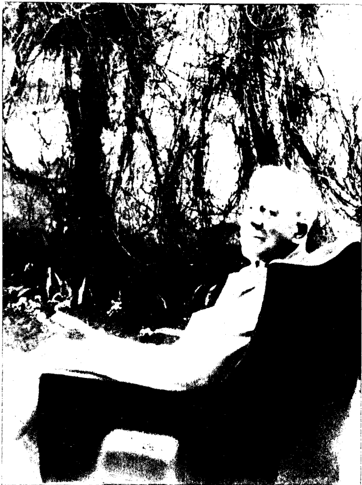
În curtea casei din str. Mecet.