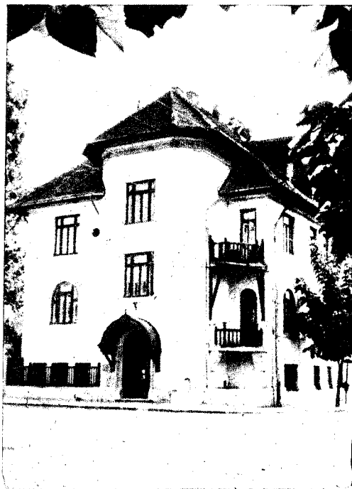
Ultima locuință a scri- torului (București, strada Mecet nr. 24).