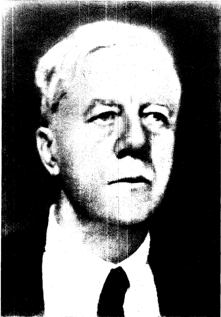
Scriitorul în ultimii ani ai vieții.