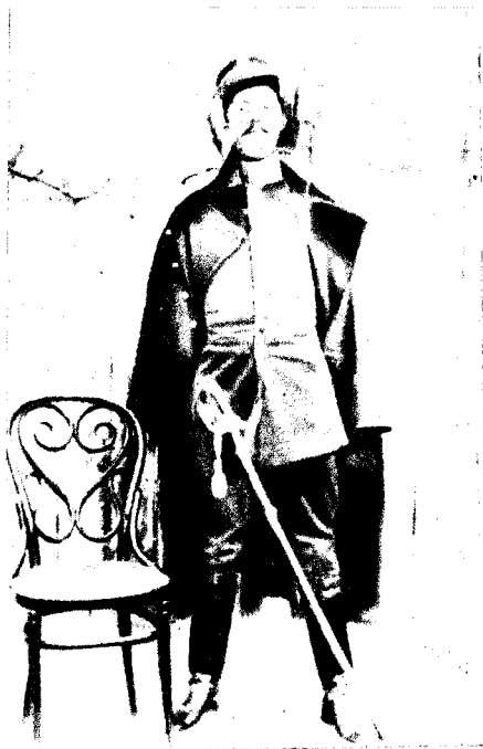
Profesor la școala militară din București (1912).