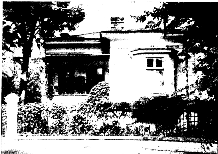
Casa din București (Aleea Rignault nr. 7), unde Brăescu a scris cea mai mare parte a operei sale.