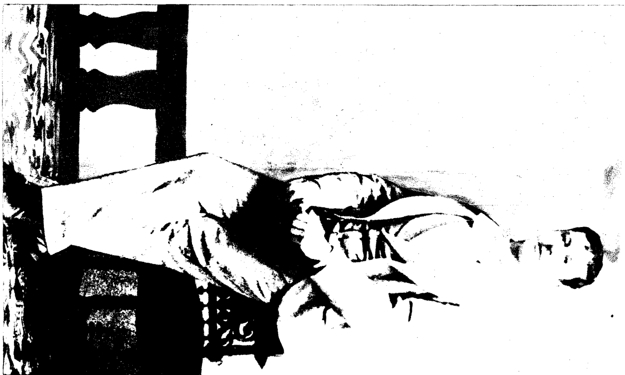
Gh. Brăescu la 18 ani (1889).