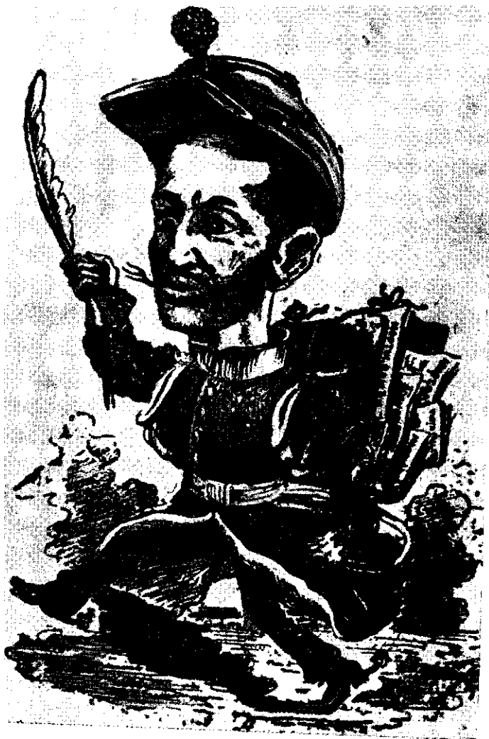
Anton Bacalbașa apărută în Adevărul ilustrat din 1895.)

— Priceput. I-a spune- Mii acuma, ce gîndești despre publicul cetitor? Făout-a el un progres, ori stă locului?