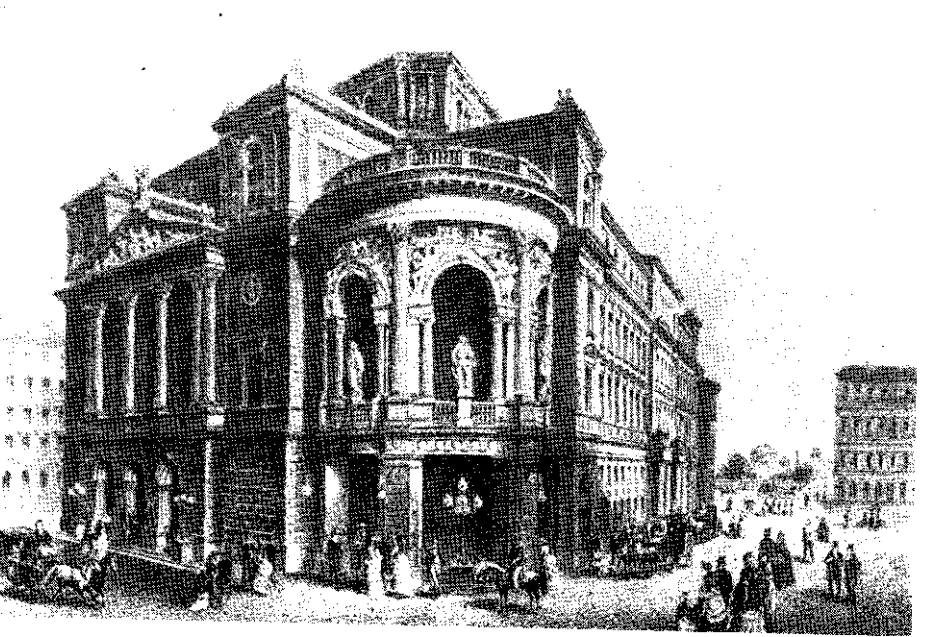
Opera din Viena